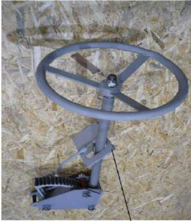
стопор в сборе